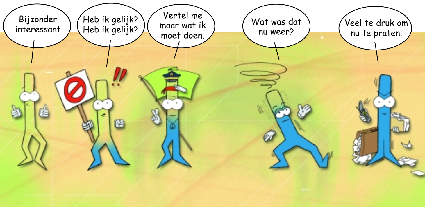
Figuur 2: Aandachtseenheden