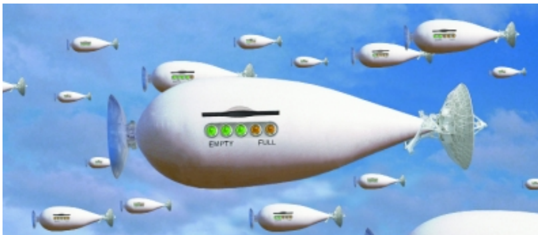
Figuur 3: Vrije-aandachtseenheid luchtballon

Sommige zaken zijn zo buitengewoon belangrijk en interessant, dat je alle luchtballonnen moet sturen waarover je beschikt.